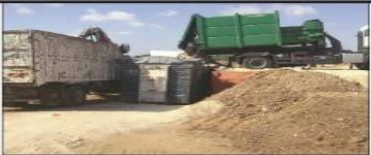
המשבר האשפה בחדרה, העירייה נעזרת

שבועיים מפרוץ המשבר הגדול, העיר חדרה עדיין מלאה באשפה • ראש העירייה החליט לחקור, בינתיים העירייה נעזרת בפתרון של שתי מיכליות גדולות באזור עמק חפר